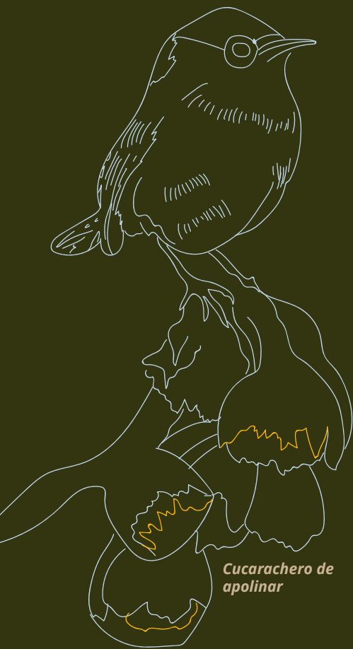
Cucarachero de apolinar

García, Rolando. Sistemas Complejos: Conceptos, Métodos y Fundamentación Epistemológica de La Investigación Interdisciplinaria. (Filosofía de La Ciencia. Gedisa, S.A.: Serie CLA-DE-MA. Gedisa, 2006).