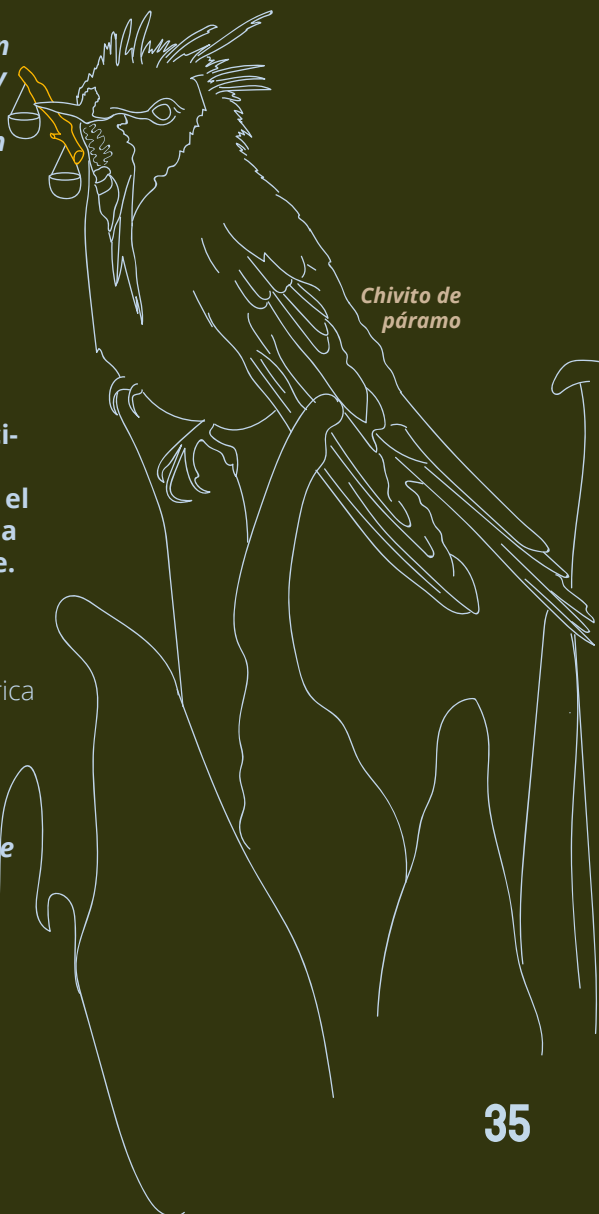
Chivito de páramo